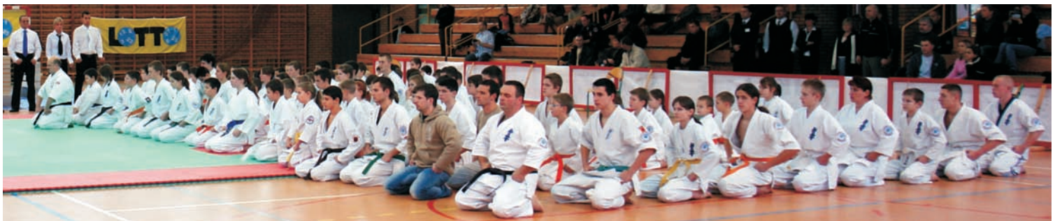
Zawodnicy w pozycji seiza podczas ceremonii otwarcia turnieju.