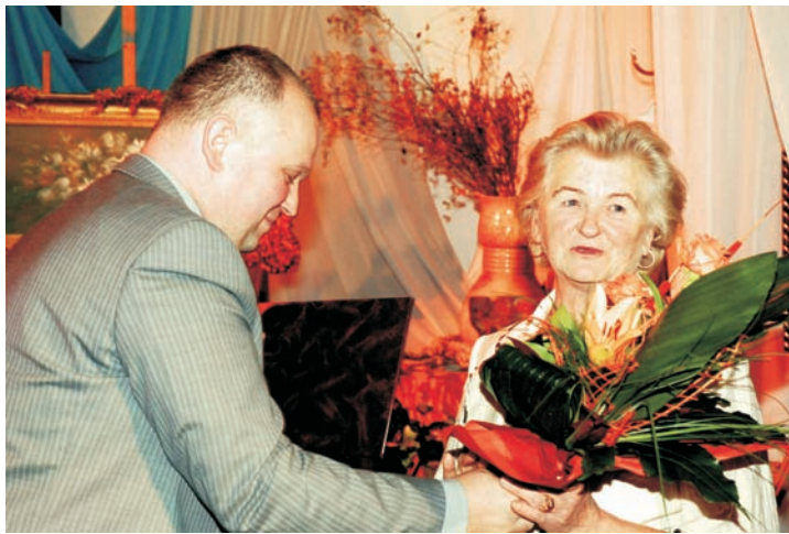
30-lecie Klubu Plastyka "Impresja"