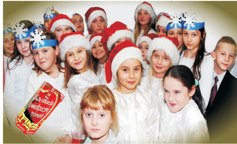
W Choszcźnie podczas XVI Finału WOŚP zebrano 28.354,77 zł