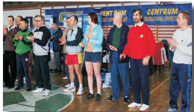
Cukiernia „Bakers”, Zarząd Oddziału ZNP w Choszczynie.

W dniu 15 marca 2008 r. odbyły się Jubileuszowe X Mistrzostwa Polski Nauczycieli i Pracowników Oświaty w Badmintonie. Organizatorem był Zarząd Oddziału ZNP w Choszczynie przy współudziale Centrum Sportowo Rekreacyjnego w Choszczynie. Sponsorami imprezy był Zarząd Główny ZNP, Zarząd Zachodniopomorskiego Okręgu ZNP, Burmistrz Choszczyna, Starosta Powiatu, Szczecińska Szkoła Wyższa Collegium Balticum, Centrum Rekreacyjno - Sportowe, Przewodniczący Powiatowej Rady LZS, Konwent Klubu 99, Dyrektor Zespołu Szkół Nr 1 w Choszczynie, Spółka „Absolut”,