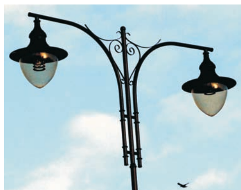
Wymiana oświetlenia - ul. Artylerzystów, Kanałowa, Kruczkowskiego, Miodowa, Ogrodowa, Polna, Reymonta, Sportowa, Wolności, Żeglarska. Modernizacja lamp i opraw na energooszczędne. Spłata inwestycji następuje automatycznie z oszczędności ze spadku zużytej energii. Czas ok. 7 lat. Koszt: 2 200 000 PLN