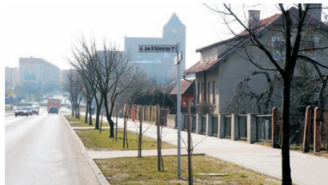
Przebudowa ul. Wolności i ul. Stargardzkiej. Inwestycja przebudowy chodników i zatoki, wykonana w 2007 r. przez Zarząd Dróg Wojewódzkich przy udziale finansowym Gminy Choszczo. Udział gminy: 116 000 PLN