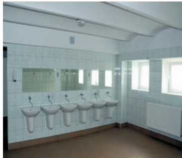
Remont toalet w Szkole Podstawowej nr 1 i nr 3 w Choszczynie.

Przebudowa ul. Piastowskiej. Odtworzenie nawierzchni asfaltowej, odwodnienie, przebudowa chodnika.