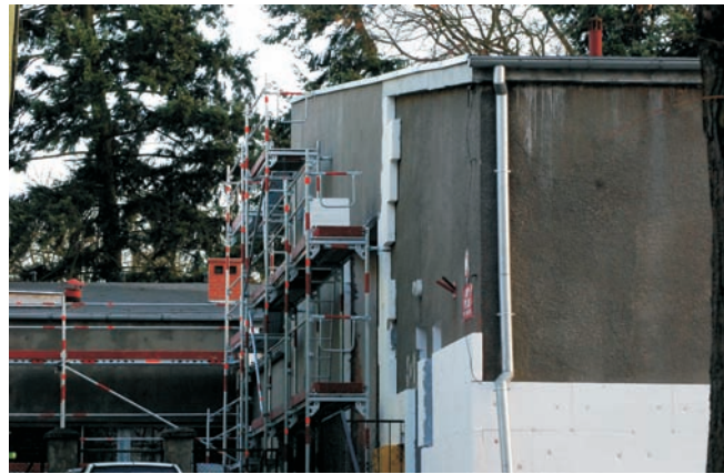
Termomodernizacja budynku oraz przebudowa kotłowni gazowej w Miejskiej Bibliotece Publicznej. Zadanie inwestycyjne na lata 2007-2009. Modernizacja kotłowni, izolacja ścian, docieplenie ścian zewnętrznych. Wymiana chodników i naprawa fontanny. Koszt: 563 000 PLN